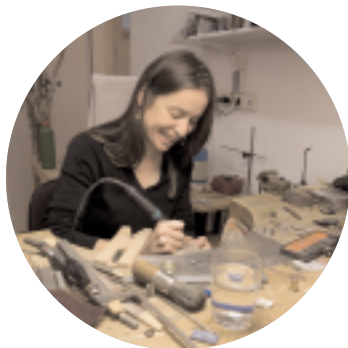
Alles mit viel Liebe von Hand gemacht.